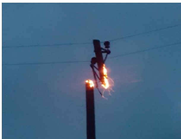
SLIKA 2. POŽAR UZROKOVAN POSOLICOM

Dijelovi mreže na kojima dolazi do kvarova (drveni stupovi sa savijenim i ravnim nosačima) nisu međusobno kratko spojeni nego su pričvršćeni na drvo. Kvarovi su uvijek mehaničke prirode jer se usljed gorenja stupa na mjestu na kojem je nosač pričvršćen za stup, nosač sa izolatorom odvoji od stupa te dolazi do dodirivanja vodiča, međusobno ili sa zemljom. Kako je kod "problematične" vrste ovjesa izolatora raspored vodiča u tzv. jelu, paljenje drvenog stupa započinje na nekom od nosača, bez pravila. Najnepovoljniji mogući događaj je kada se kompletan vrh stupa sruši, svi izolatori ostanu na njemu a vodno polje i dalje bude pod naponom te nas ne alarmira o kvaru. Istovremeno iskre padaju na tlo sa oba kraja zapaljenog dijela stupa. Bitna je činjenica da uslijed malih proboja dielektrične čvrstoće izolatora, koja nisu dovoljna za uspostavu luka ne dolazi do ispada zemljospojne ni druge zaštite. Struje koje se stvaraju između izolatora, preko čelične konstrukcije i drugog izolatora, proizvedene uslijed linijskog napona nisu dovoljne za proradu zaštite.