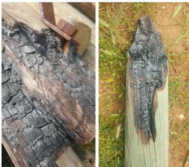
SLIKA 1. IZGORENI DRVENI STUPOVI

Do problema u opskrbi dolazi u trenutku kada na onečišćene izolatore padne rosulja ili slaba kiša, koja ne uspije isprati onečišćenja nastala tijekom sušnih i vjetrovitih dana, barem sa gornje strane izolatora. Da bi pojava elektropolarizacije tankog sloja onečišćenja na izolatorima počela, sloj onečišćenja (najčešće morske soli sa prašinom različitog podrijetla) mora doći u kontakt sa vodom čija količina nije dovoljna za mehaničko ispiranje onečišćenja. Potrebno je naglasiti da prekida isporuke zbog proboja dielektrične čvrstoće VHD izolatora nikada nije bilo zbog kvara na betonskim stupovima, čeličnim gama konzolama na drvenim stupovima, uzemljenim rastavljačima na drvenim stupovima i čelično rešetkastim trafostanicama - kod navedenih dijelova mreže potporna konstrukcija koja nosi VHD izolatore je praktički kratko spojena.